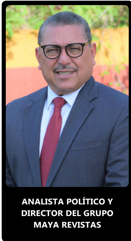
ANALISTA POLÍTICO Y DIRECTOR DEL GRUPO MAYA REVISTAS