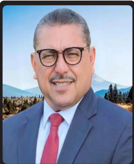
ANALISTA POLÍTICO Y DIRECTOR DEL GRUPO MAYA REVISTAS

P or un lado, presenta al equipo de campaña netamente político y partidista, las y los integrantes del equipo de precampaña a la Presidencia de la República son los siguientes: