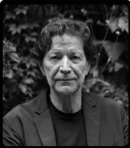
COLABORADOR EDITORIAL Periodista de Izquierda, Escritor, Analista Político, Economista Y Sociólogo Mexicano.