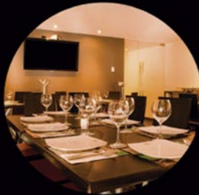
EL DORADO GOURMET