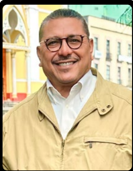
ANALISTA POLÍTICO Y DIRECTOR DEL GRUPO MAYA REVISTAS

L as feministas se congratulan del ascenso femenino en la vida pública del país, pero la agenda de la igualdad se mantiene en la incertidumbre.