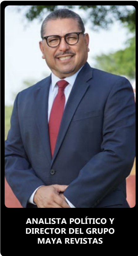
ANALISTA POLÍTICO Y DIRECTOR DEL GRUPO MAYA REVISTAS

E l nuevo gobierno de México que encabeza la nueva presidente de México, Claudia Sheinbaum Pardo, uno de los principales objetivos que tiene es lograr una plena conectividad entre las principales ciudades del país. Contar con adecuado sistema de transporte eficiente, menos contaminante y bajo costo, con esta acción se permitirá un pleno desarrollo social, comercial y económico, por lo que en este mandato están contempladas 8 nuevas líneas de trenes de pasajeros y carga.